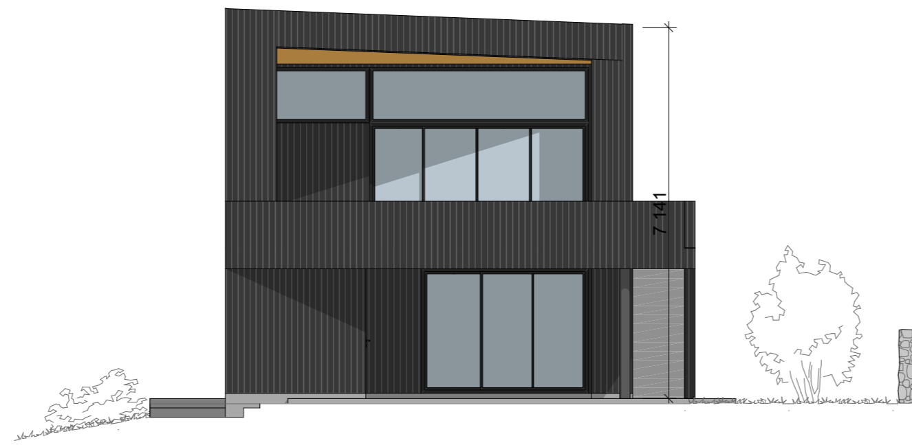
1:100 Fasade Vest