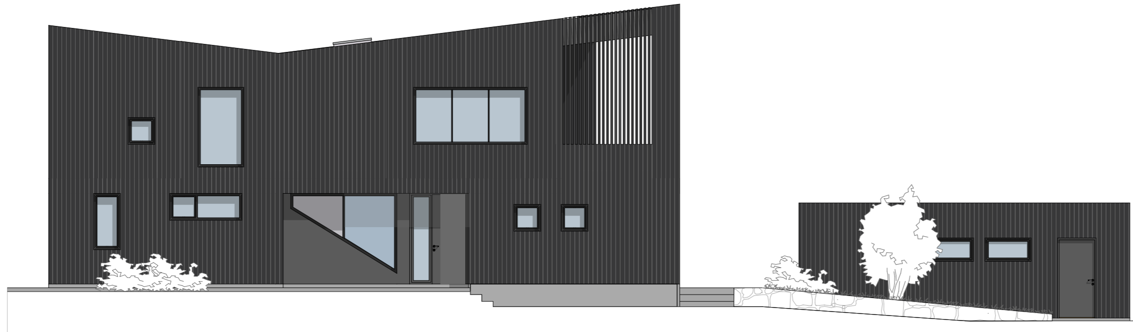
1:100 Fasade Nord