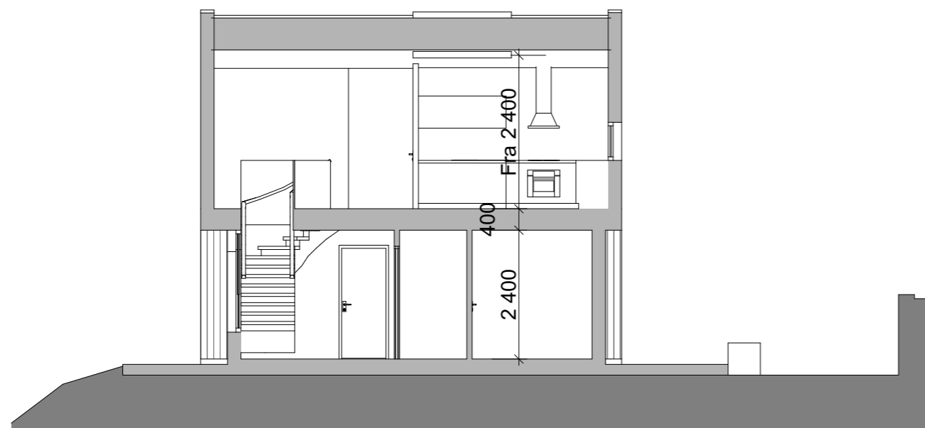
1:100 Snitt A