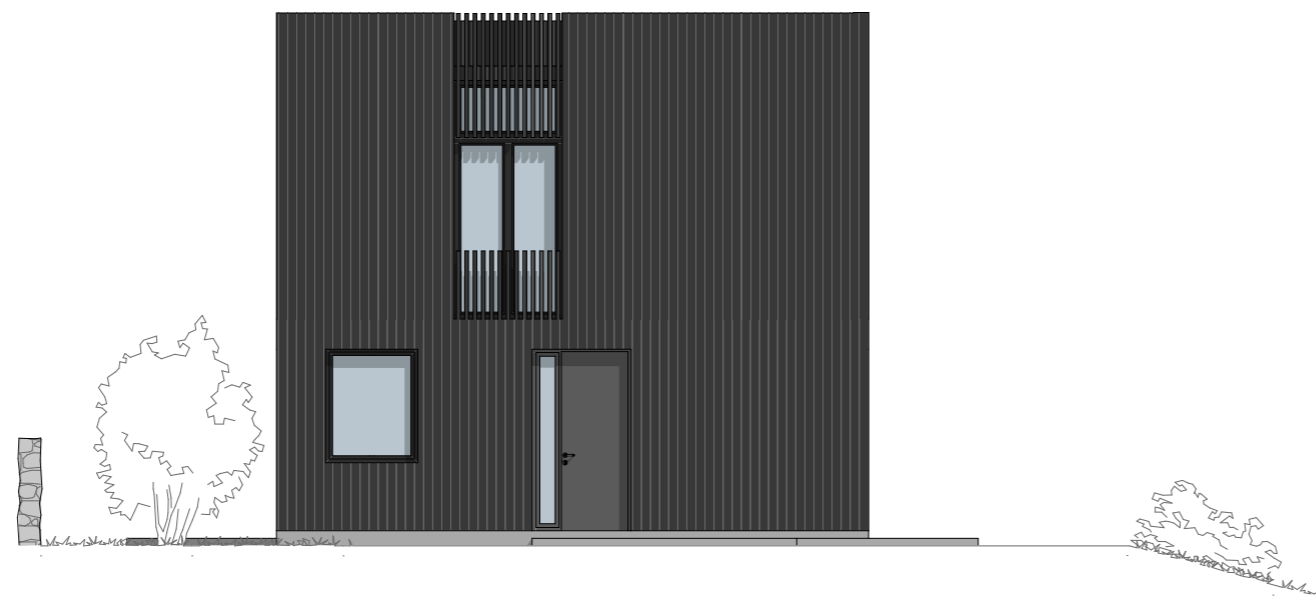
1:100 Fasade Øst